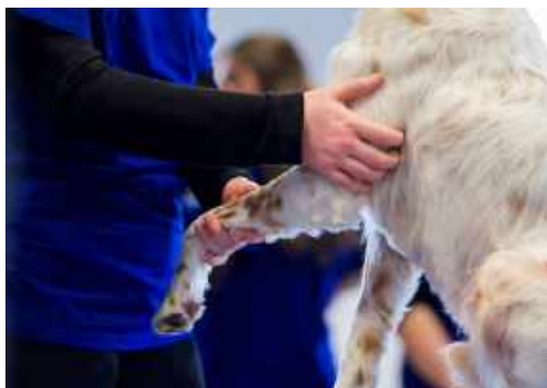
Cours de pratique interne sur canidés

Pendant 5 ans, notre équipe d'enseignants, tous professionnels de santé animale reconnus et en activité , encadre et accompagne nos élèves dans l'apprentissage de leur métier. Chirurgiens spécialisés, vétérinaires, ostéopathes animaliers ou comportementalistes se mobilisent pour transmettre et développer avec rigueur les connaissances et compétences de leurs étudiants.