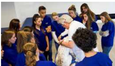
5 ans d'étude à l'ISEMA

Inscription au registre national des Ostéopathes Animaliers et exercice du métier