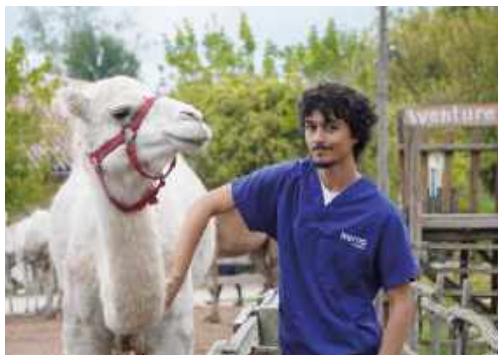
Cours de pratique externe sur camélidés chez notre partenaire La Ferme Exotique de Cadaujac